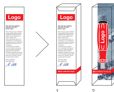
Darstellung der Geschenkverpackung mit individuell gestalteter Grussbotschaft. Ansicht Rückseite (1) und Vorderseite (2).

Dank der hochwertigen, transparenten Box ist Ihr aufgedrucktes Firmenlogo auf dem Werkzeug und auf der Karte sofort ersichtlich. Jeder Verpackung ist eine Bedienungsanleitung beigelegt.